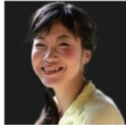
俳優 森山 冬子 (SPAC)